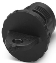
Kunststoff-Schutzkappe, M17, Serie: M17 PRO

Bitte beachten Sie, dass die in diesem PDF-Dokument angezeigten Daten aus unserem Online-Katalog generiert wurden. Bitte finden Sie die vollständigen Daten in der Benutzer-Dokumentation. Es gelten unsere Allgemeinen Nutzungsbedingungen für Downloads.